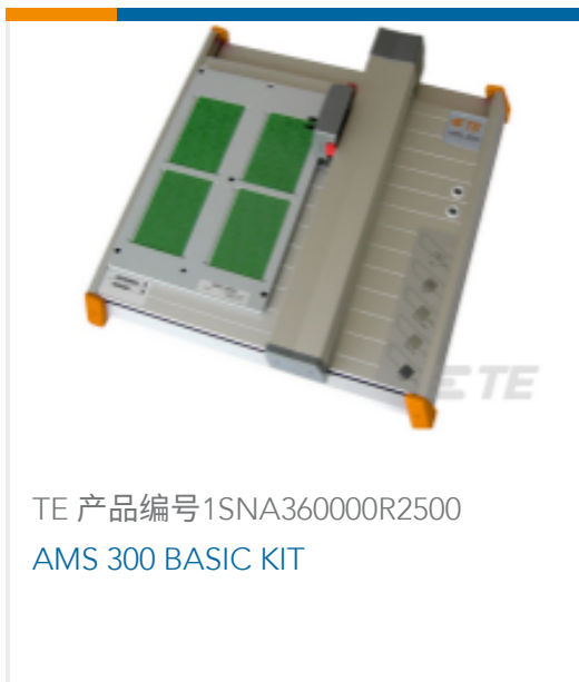
TE 产品编号1SNA360000R2500 AMS 300 BASIC KIT