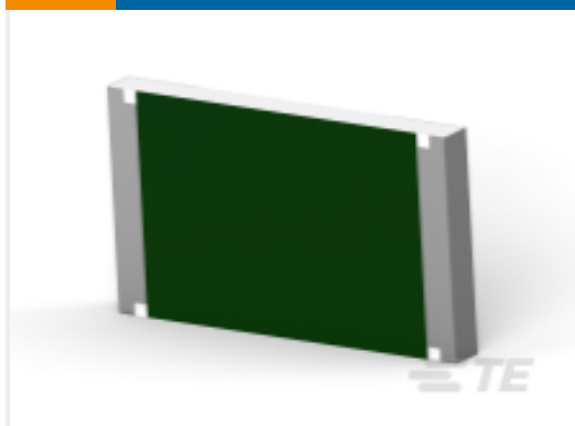
TE 产品编号 5-2176408-3 3560 5M6 5%