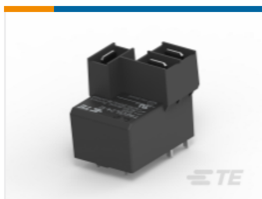
TE 产品编号1558676-6 T9GS1L24-22