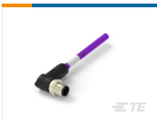
TE 产品编号TAB62246501-040 M12B2-MR-PUR TORSION-4.0M