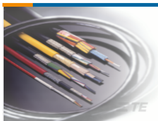
TE 产品编号D541243001 100G0111-2.50-0CK0226