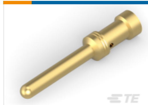
TE 产品编号T2030011015-000 DEM-1.5