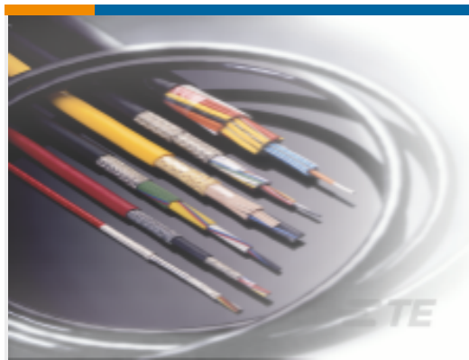
TE 产品编号E661373001 100G0111-1.00-0CK0226