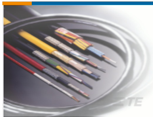
TE 产品编号3665183001 100G0111-1.50-0CK0226