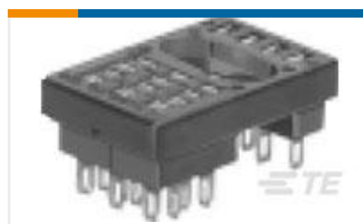
TE 产品编号 3-1393143-1 27E271=SOCKET,R10,22,PC,PHEN