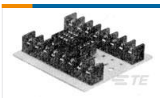
TE 产品编号 4-1393143-5 27E462=SOCKET,R10,6POLE,TRACK-MNT,SCREW