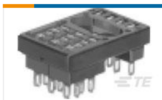
TE 产品编号 1-1393143-3 27E130=SOCKET,R10,22,PC,PHEN