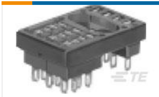
TE 产品编号 4-1393143-9 27E630=SOCKET,R10,6POLE,PCB,.180