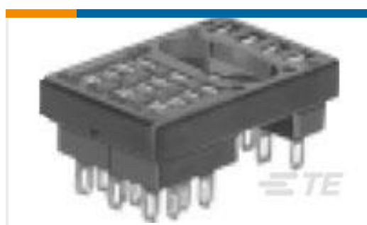
TE 产品编号 1-1393143-0 27E127=SOCKET,R10,22,SLG,PHE