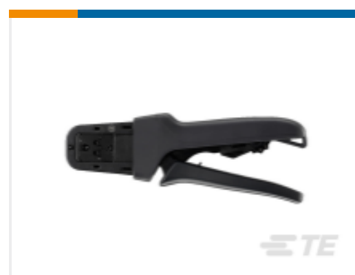
TE 产品编号DTT-20-03 CRIMP TOOL