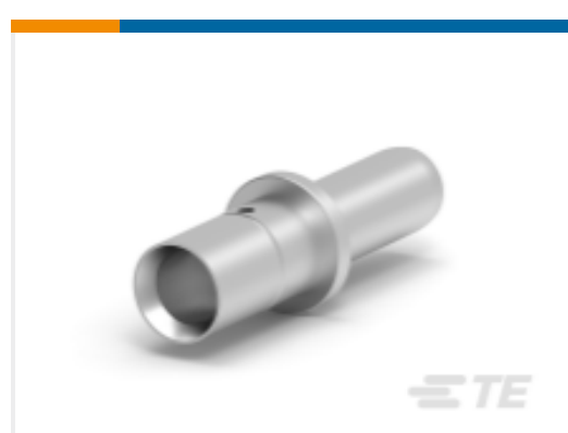
TE 产品编号SRK-PC-080-25-601 PIN, SOLID, SIZE M8, 25mm2, AG