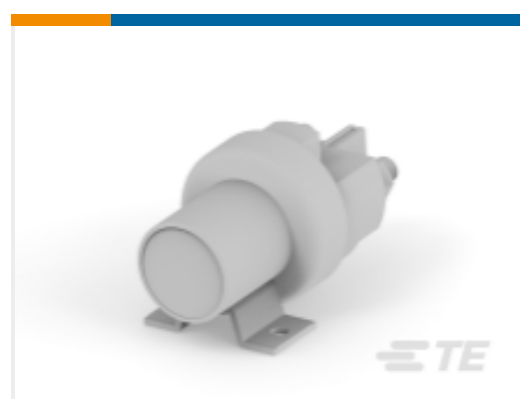
TE 产品编号K1008699 Relay 26-60-05