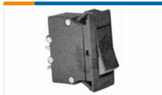
TE 产品编号3-1423673-9 W51-A152A1-5=CKTBKR,THERM,ROC