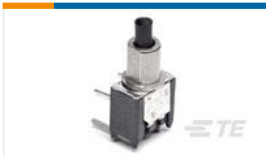
TE 产品编号1825095-2 TP11CGPC204