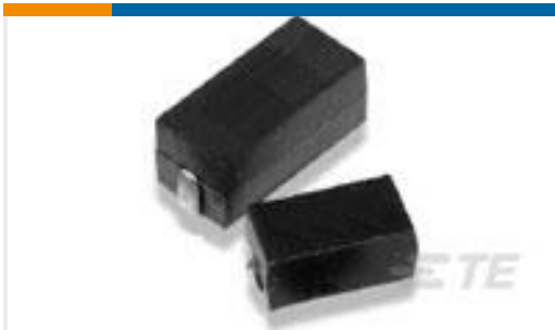
TE 产品编号1879234-7 SMF5 910R 5%