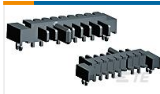
TE 产品编号1827654-2 2mm pitch Battery Plug Assy. 7P. H=4.0