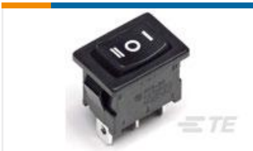
TE 产品编号1571079-4 PRASD1-16F-BB000=POWER ROCKER