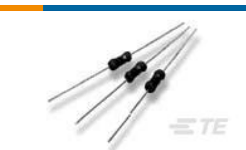
TE 产品编号3-1879354-2 RR03 5% 6R2 AMMO