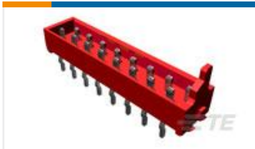
TE 产品编号7-215464-4 04P.MICRO-MATCH MOB