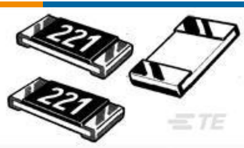
TE 产品编号4-2176230-6 3522 4K7 5% 3W