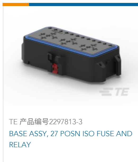
TE 产品编号2297813-3 BASE ASSY, 27 POSN ISO FUSE AND RELAY