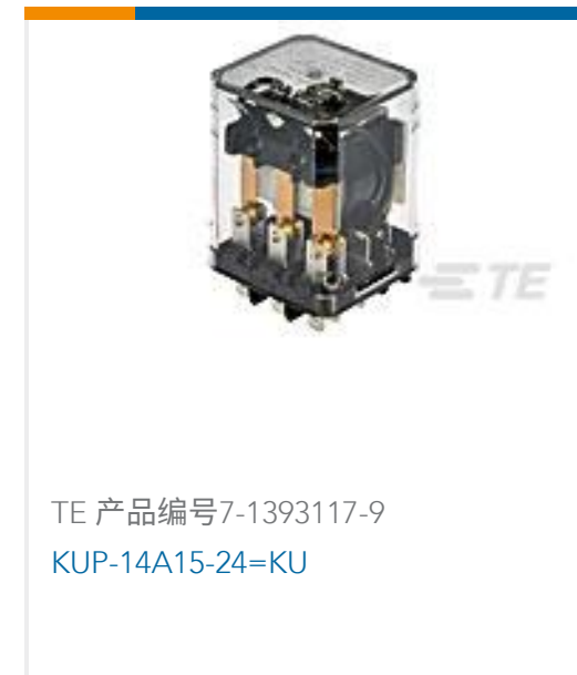
TE 产品编号7-1393117-9 KUP-14A15-24=KU