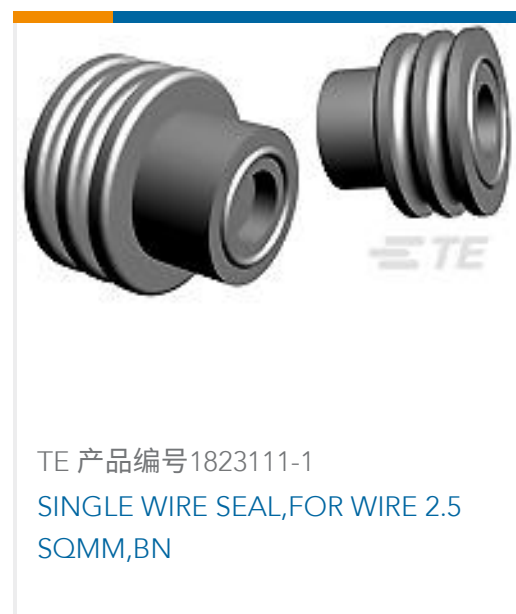
TE 产品编号1823111-1 SINGLE WIRE SEAL, FOR WIRE 2.5 SQMM, BN