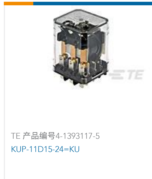
TE 产品编号4-1393117-5 KUP-11D15-24=KU