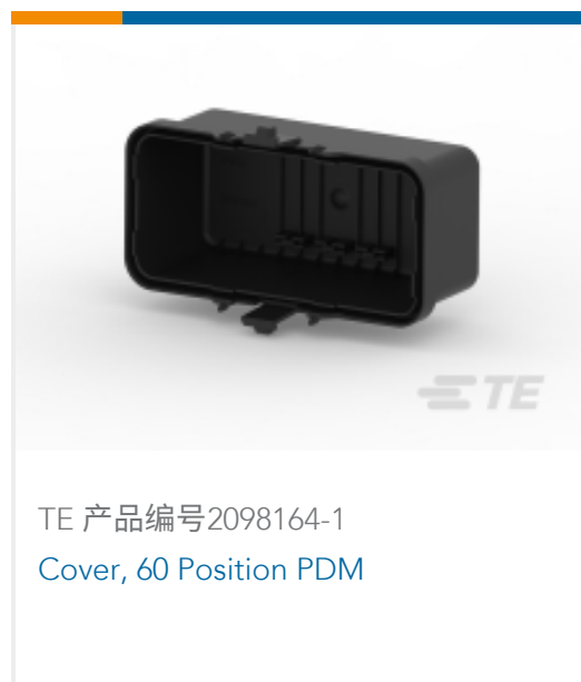
TE 产品编号2098164-1 Cover, 60 Position PDM