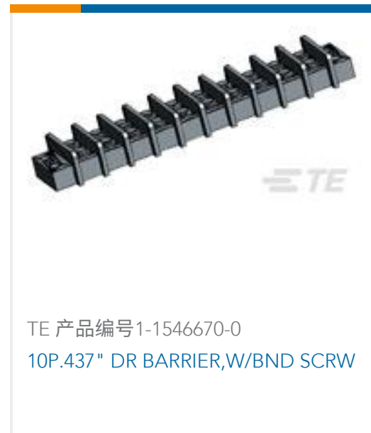
TE 产品编号1-1546670-0 10P.437" DR BARRIER, W/BND SCRW