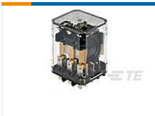
TE 产品编号 7-1393118-0 KUP-5D55-12=KU