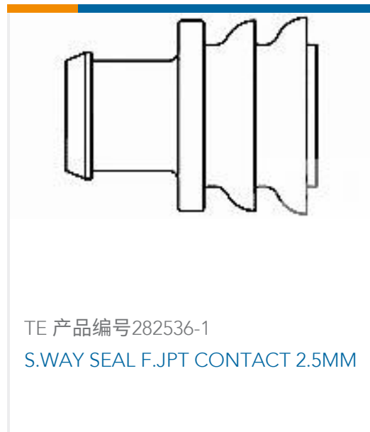
TE 产品编号282536-1 S.WAY SEAL F. JPT CONTACT 2.5MM