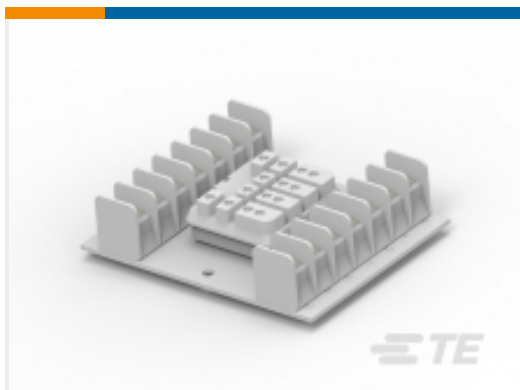
TE 产品编号 2-1419106-2 27E867=SOCKET,KU,,ASSY,4 POLE,