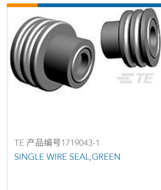
TE 产品编号1719043-1 SINGLE WIRE SEAL, GREEN