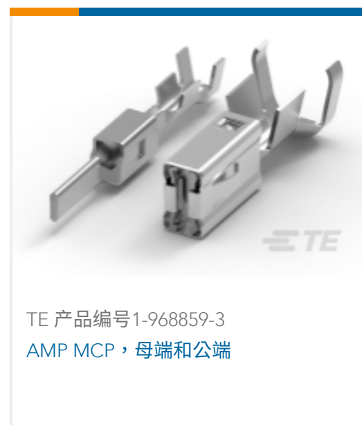
TE 产品编号1-968859-3 AMP MCP, 母端和公端