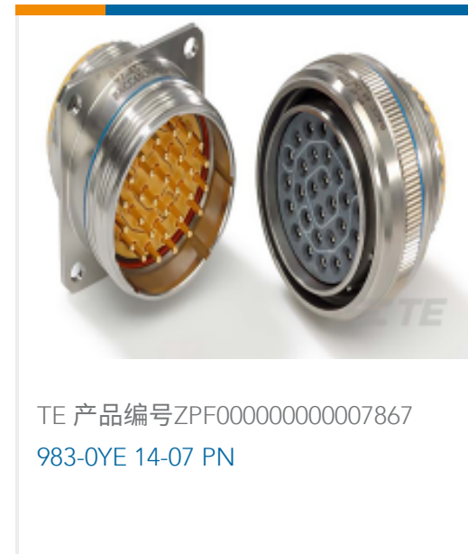
TE 产品编号ZPF00000000007867 983-0YE 14-07 PN