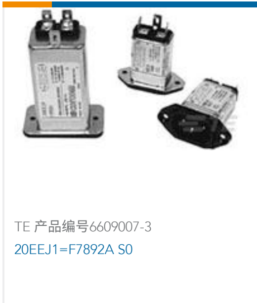
TE 产品编号6609007-3 20EEJ1=F7892A S0