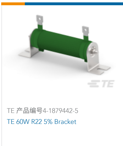
TE 产品编号4-1879442-5 TE 60W R22 5% Bracket