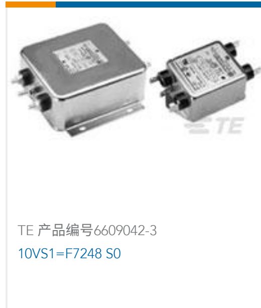
TE 产品编号6609042-3 10VS1=F7248 S0