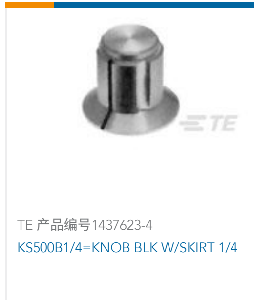
TE 产品编号1437623-4 KS500B1/4=KNOB BLK W/SKIRT 1/4