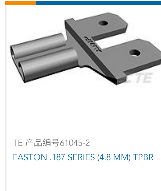
TE 产品编号61045-2 FASTON .187 SERIES (4.8 MM) TPBR