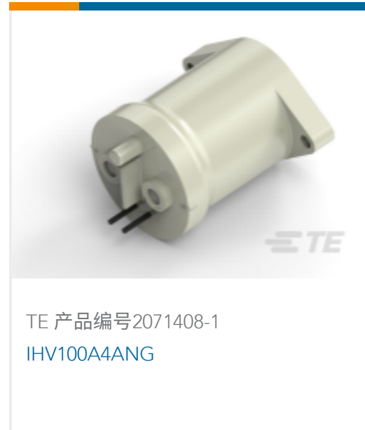
TE 产品编号2071408-1 IHV100A4ANG