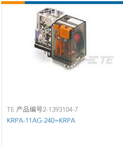
TE 产品编号2-1393104-7 KRPA-11AG-240=KRPA