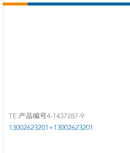
TE 产品编号4-1437287-9 13002623201=13002623201