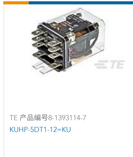
TE 产品编号8-1393114-7 KUHP-5DT1-12=KU