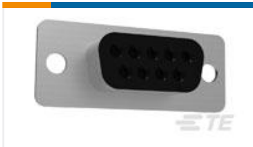
TE 产品编号205203-3 CRIMP SNAP RCPT ASSY,SIZE 1