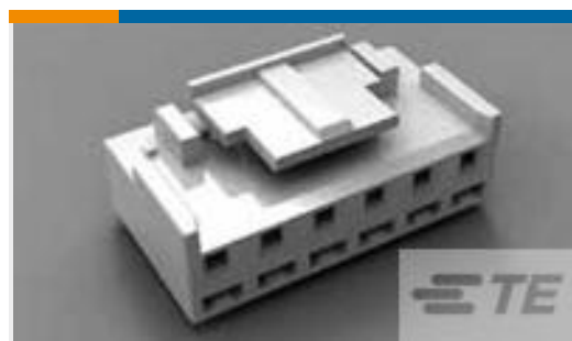
TE 产品编号4-1123722-3 3.96 EP PLUG HSG 3P(RED)