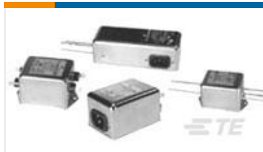
TE 产品编号6609054-1 3EHQ1=F7671 S0