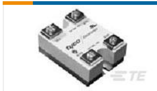
TE 产品编号2-1393030-2 SSRT-240D25 = PANEL MOUNT,25A, 240VAC