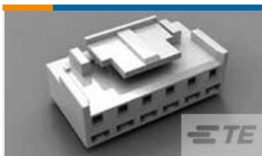
TE 产品编号1-1123722-2 3.96 EP PLUG HSG 2P(NATURAL)