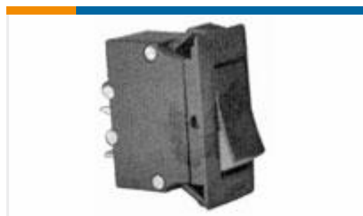
TE 产品编号1423673-5 W51-A121B1-10=CKTBKR,THERM,ROC