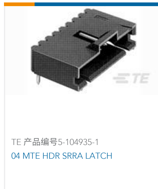
TE 产品编号 5-104935-1 04 MTE HDR SRRA LATCH