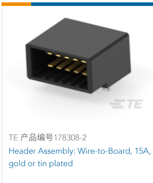
TE 产品编号 178308-2 Header Assembly: Wire-to-Board, 15A, gold or tin plated