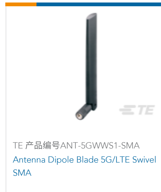
TE 产品编号 ANT-5GWWS1-SMA Antenna Dipole Blade 5G/LTE Swivel SMA