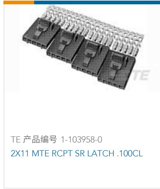
TE 产品编号 1-103958-0 2X11 MTE RCPT SR LATCH .100CL