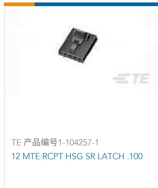
TE 产品编号 1-104257-1 12 MTE RCPT HSG SR LATCH .100