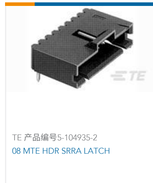
TE 产品编号 5-104935-2 08 MTE HDR SRRA LATCH