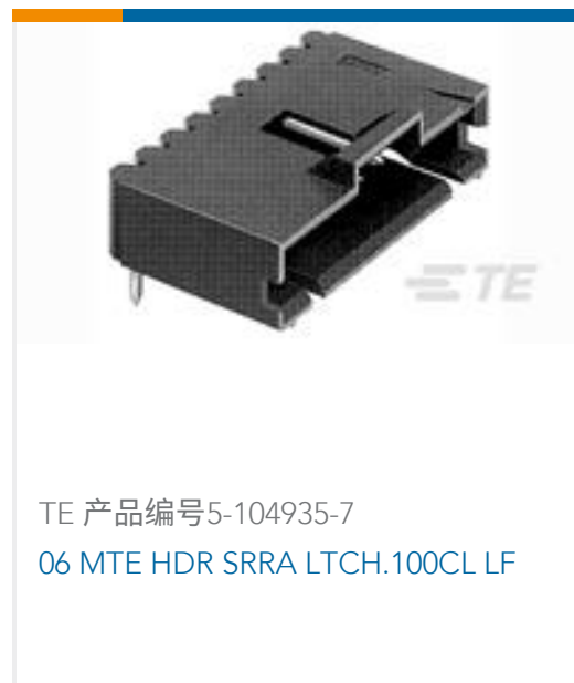
TE 产品编号 5-104935-7 06 MTE HDR SRRA LTCH.100CL LF