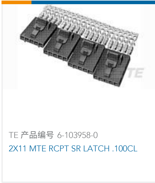
TE 产品编号 6-103958-0 2X11 MTE RCPT SR LATCH .100CL