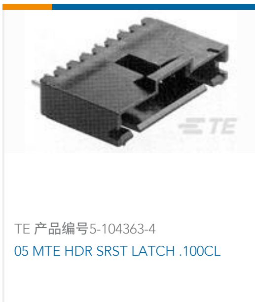
TE 产品编号 5-104363-4 05 MTE HDR SRST LATCH .100CL