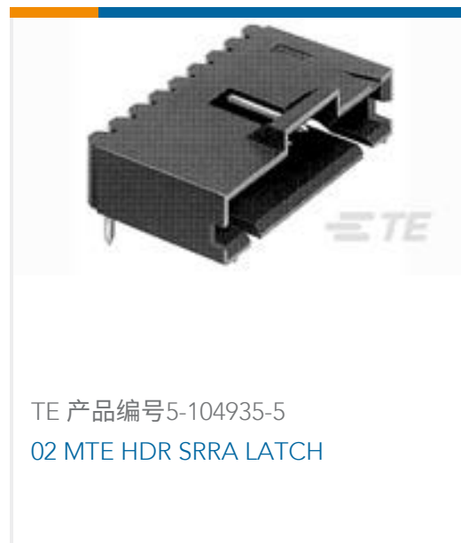
TE 产品编号 5-104935-5 02 MTE HDR SRRA LATCH