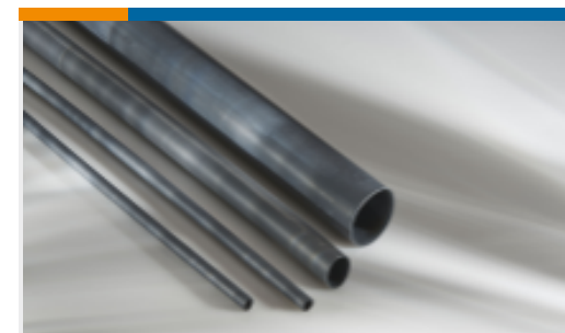
TE 产品编号EH2292-000 DWFR-19/6-0-STK