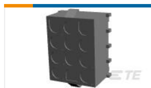
TE 产品编号350829-1 12P UMNL HDR ASSY PC 94VO