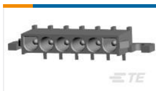
TE 产品编号640583-3 06P UMNL HDR ASSY R/A 94VO LF