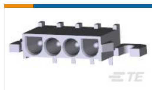
TE 产品编号3-350944-0 04P UMNL HDR ASSY R/A 94VO