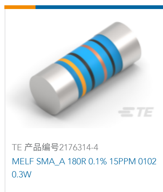
TE 产品编号2176314-4 MELF SMA_A 180R 0.1% 15PPM 0102 0.3W