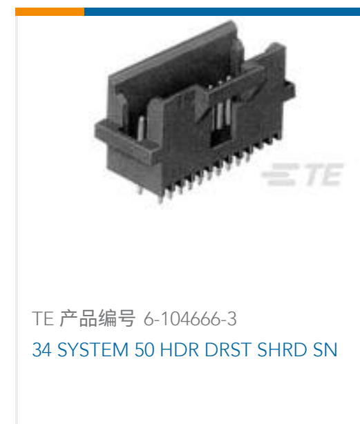
TE 产品编号 6-104666-3 34 SYSTEM 50 HDR DRST SHRD SN