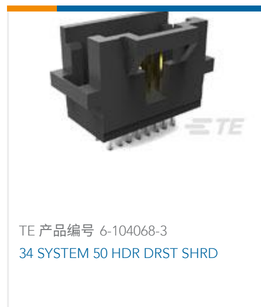
TE 产品编号 6-104068-3 34 SYSTEM 50 HDR DRST SHRD