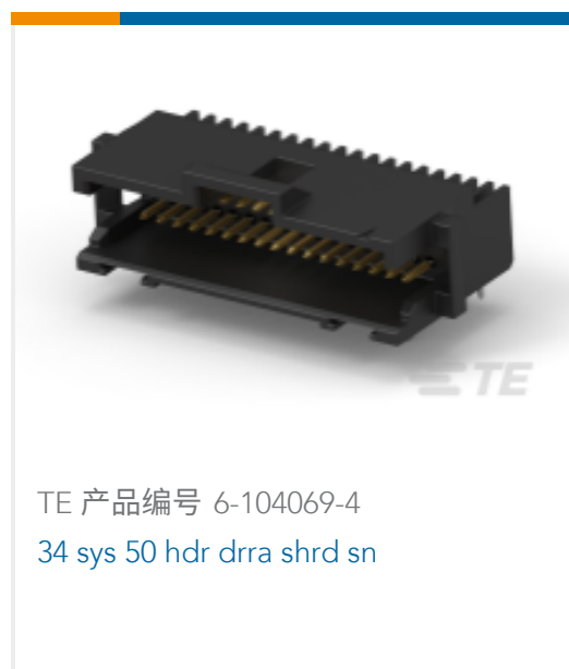
TE 产品编号 6-104069-4 34 sys 50 hdr drra shrd sn