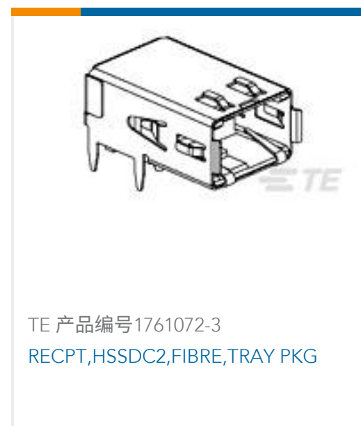
TE 产品编号1761072-3 RECPT,HSSDC2,FIBRE,TRAY PKG