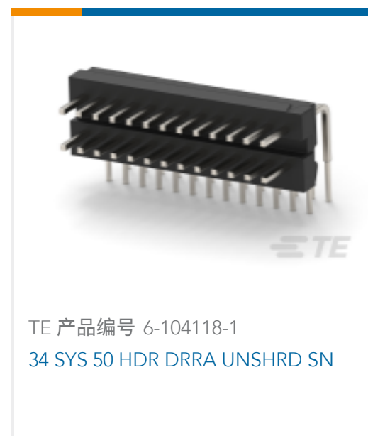
TE 产品编号 6-104118-1 34 SYS 50 HDR DRRA UNSHRD SN