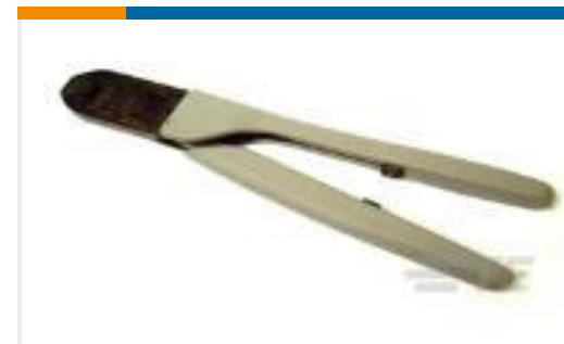
TE 产品编号91500-1 CCII UNML UNML II PIN SKT 20-14 ASSY