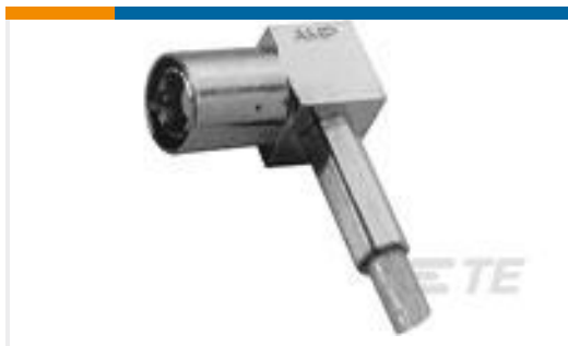
TE 产品编号5414363-4 PLUG,CABLE,RTANG,SMB, PB FREE