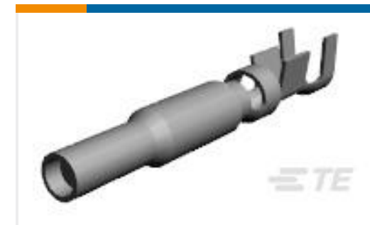
TE 产品编号1-770251-0 UMNLII SOK PTPPHBZ LP LF 20-14 ASSY