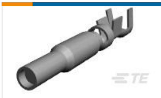
TE 产品编号1-770008-0 UMNLII SOK SN/AU/PHBZ LF