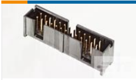
TE 产品编号5103309-6 A/L LOW PRO HDR 26P VERT BLACK