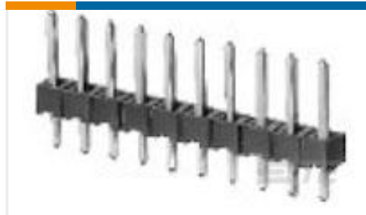
TE 产品编号5-146280-3 03 MODII HDR SRST B/A .100CL