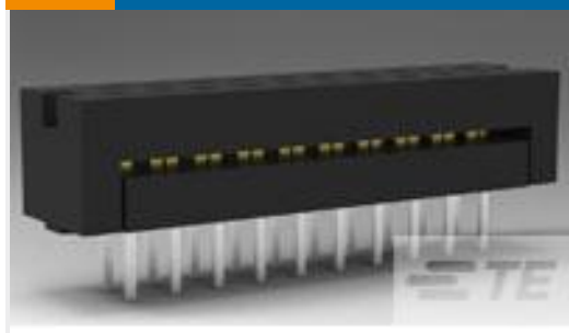
TE 产品编号2-746610-3 024 DIP PLUG 100CL TIN