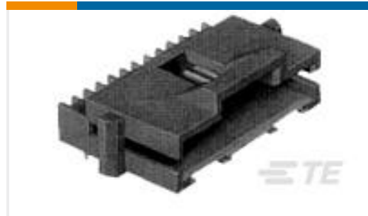
TE 产品编号6-104074-0 08 SYSTEM 50 HDR SRRA SHRD SN