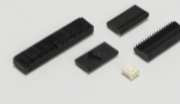
线到板连接器组件和护套(585)