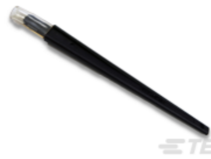
TE 产品编号 843477-1 TOOL, EXTRACTION RESET