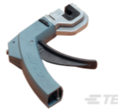
TE 产品编号 58336-1 HEAD (IDC) MODU MTE W/O TL