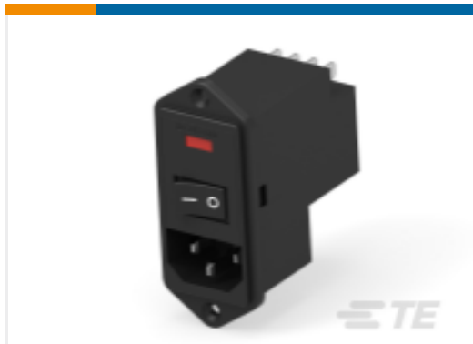
TE 产品编号1-6609940-0 PMOSSSX0=C3324