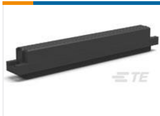
TE 产品编号746603-4 64 EUROLATCH LEAD FREE