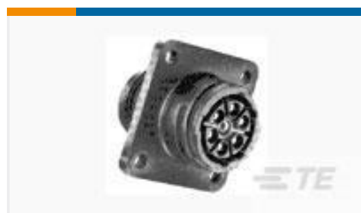
TE 产品编号211773-1 23-19 CPC RECEPT REV SEX