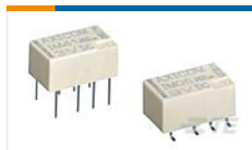
TE 产品编号1-1462037-4 IM03GR=IM RELAY 140mW 5V