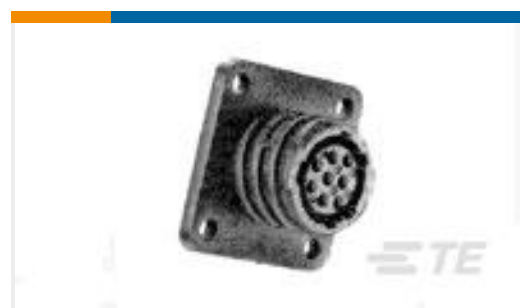
TE 产品编号206438-1 CPC RECPT ASSEMBLY SIZE 23-57