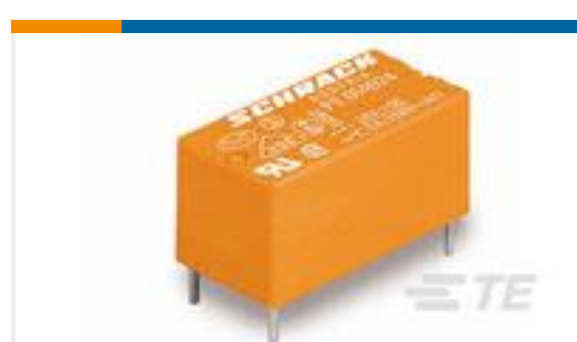
TE 产品编号1-1393219-0 PE014024