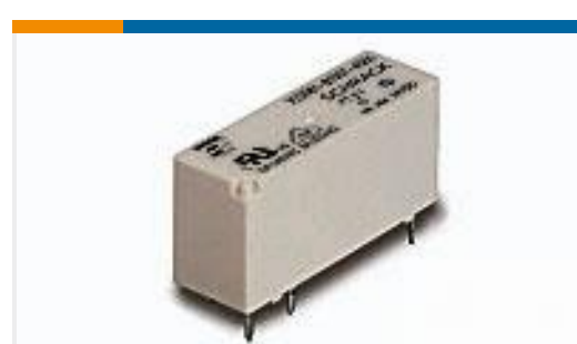
TE 产品编号9-1393222-1 V23061B1005A301=MINISTARKSTROM