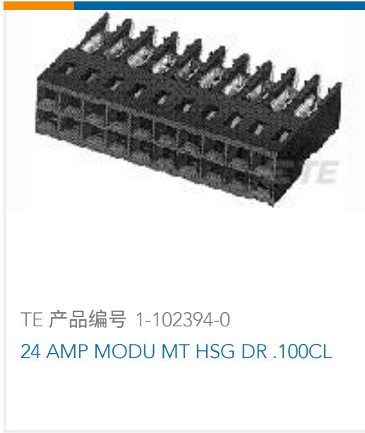
TE 产品编号 1-102394-0 24 AMP MODU MT HSG DR .100CL