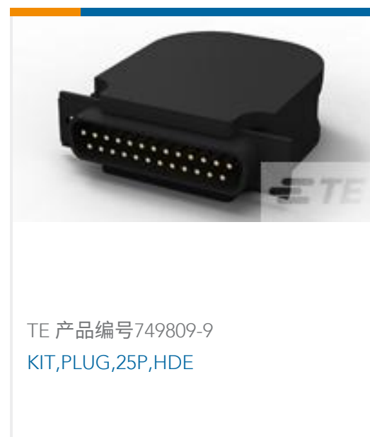
TE 产品编号749809-9 KIT, PLUG, 25P, HDE