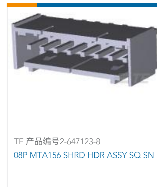
TE 产品编号2-647123-8 08P MTA156 SHRD HDR ASSY SQ SN