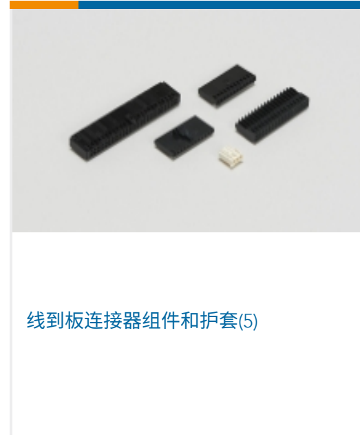
线到板连接器组件和护套(5)