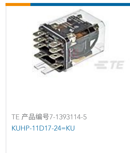
TE 产品编号7-1393114-5 KUHP-11D17-24=KU