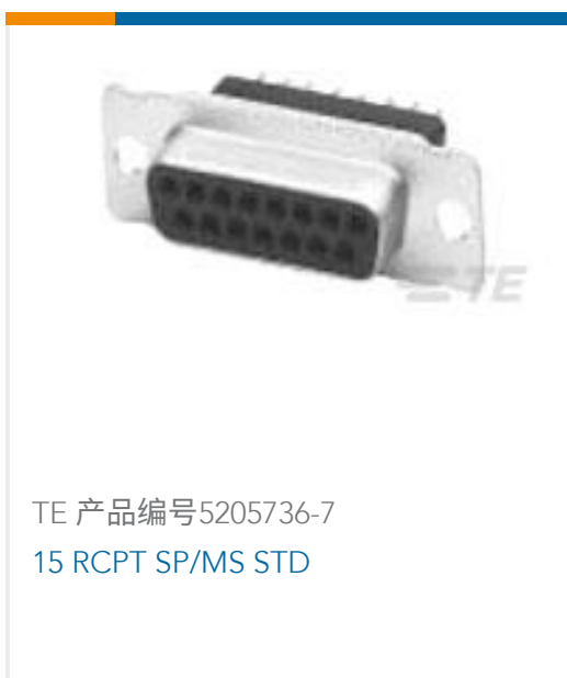
TE 产品编号5205736-7 15 RCPT SP/MS STD