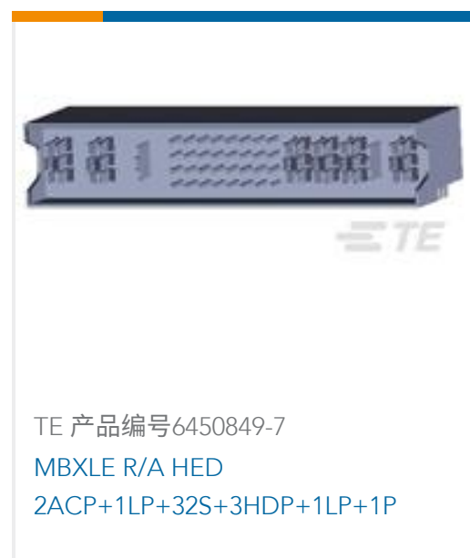
TE 产品编号6450849-7 MBXLE R/A HED 2ACP+1LP+32S+3HDP+1LP+1P