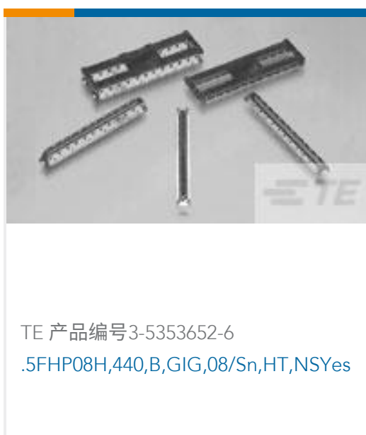
TE 产品编号3-5353652-6 .5FHP08H, 440, B, GIG, 08/Sn, HT, NSYes