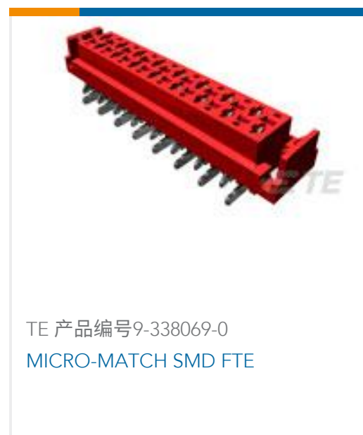
TE 产品编号9-338069-0 MICRO-MATCH SMD FTE