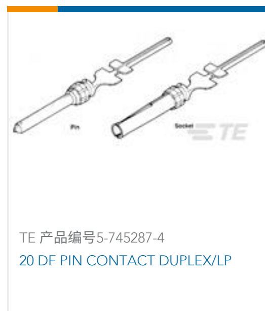
TE 产品编号5-745287-4 20 DF PIN CONTACT DUPLEX/LP