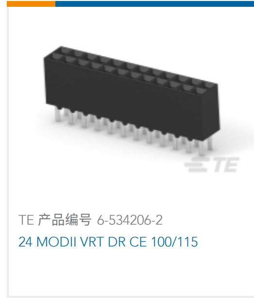
TE 产品编号 6-534206-2 24 MODII VRT DR CE 100/115