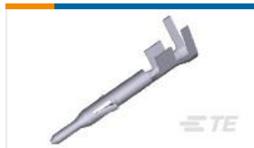
TE 产品编号1-770987-0 MINI UMNL PIN 22-18 AWG AU LP