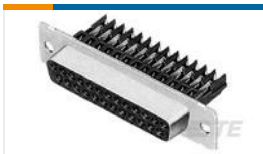
TE 产品编号1-745491-7 09 HDE MS RCPT,22-26,LEAD FREE