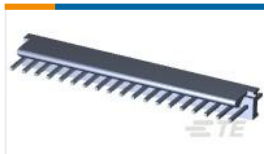
TE 产品编号1-640456-9 19P MTA100 HDR ASSY F/L SQ STR