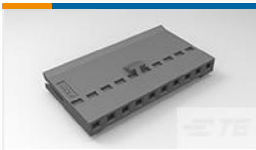
TE 产品编号 1-487769-0 012 HOUSING FFC RCPT 100CL SR