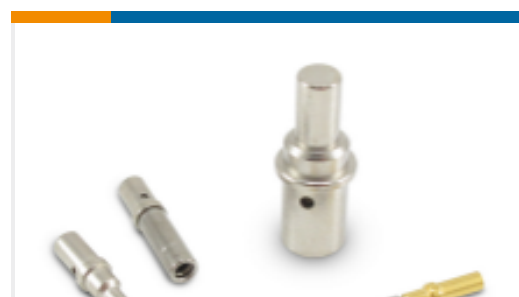
TE 产品编号0460-202-16141 DEUTSCH Solid Contacts