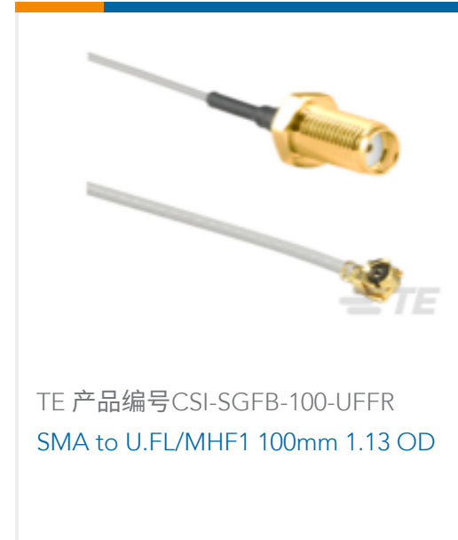
TE 产品编号CSI-SGFB-100-UFFR SMA to U.FL/MHF1 100mm 1.13 OD