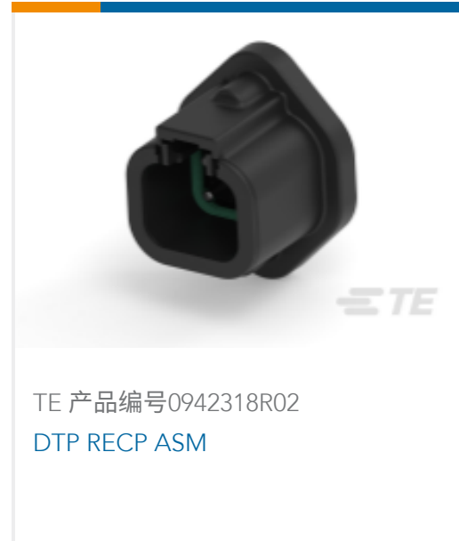
TE 产品编号0942318R02 DTP RECP ASM