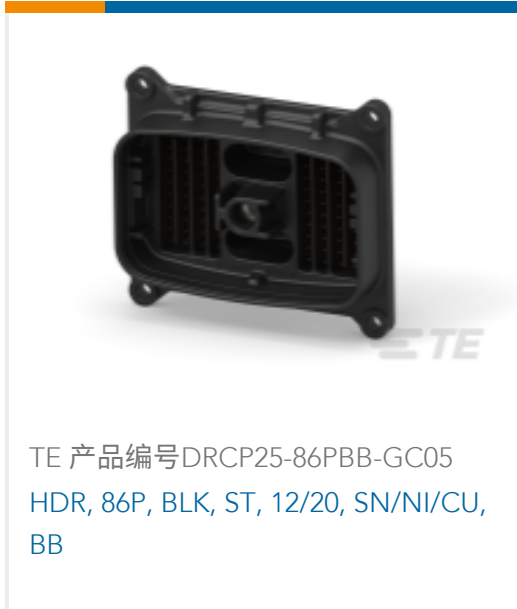
TE 产品编号DRCP25-86PBB-GC05 HDR, 86P, BLK, ST, 12/20, SN/NI/CU, BB