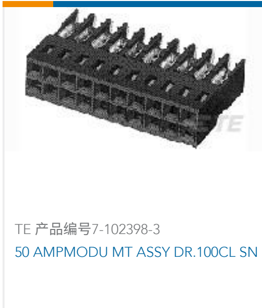
TE 产品编号7-102398-3 50 AMPMODU MT ASSY DR.100CL SN