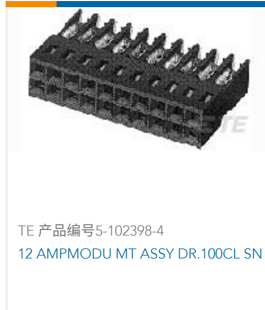
TE 产品编号5-102398-4 12 AMPMODU MT ASSY DR.100CL SN