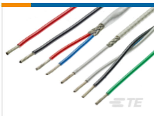
TE 产品编号2823013001 44A0211-8-9