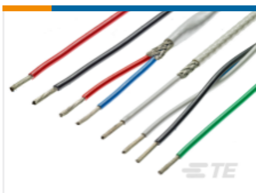
TE 产品编号2611473001 44A0111-12-54