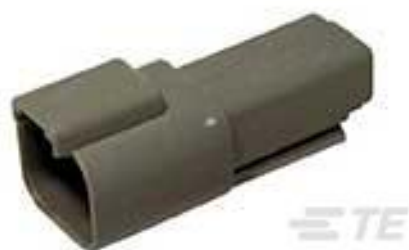
TE 产品编号DT04-2P REC, 2P, GRY, N