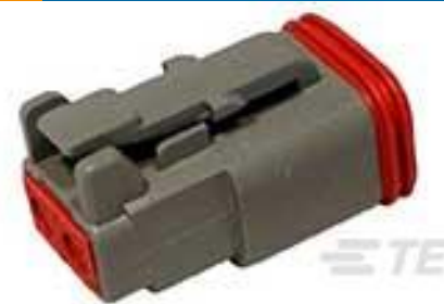
TE 产品编号DT06-2S PLG, 2P, GRY, N