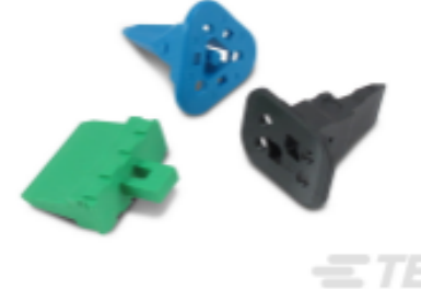
TE 产品编号W2S Wedgelocks: DEUTSCH DT