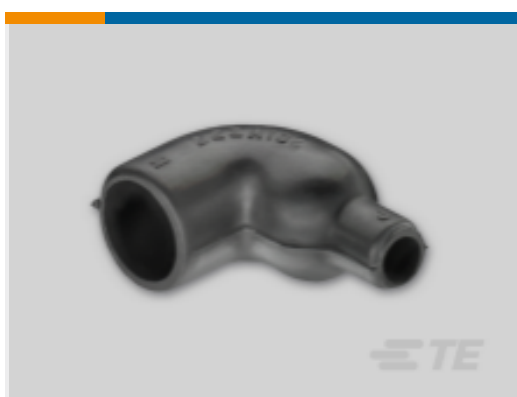
TE 产品编号806823-000 球形热缩护套：有嘴，直角