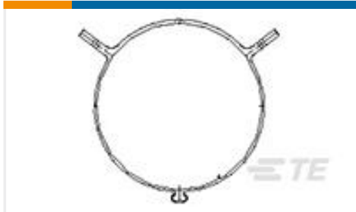
TE 产品编号814756-000 202B553-3-0