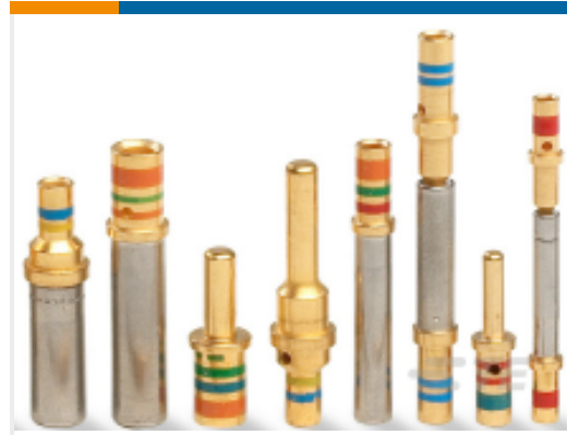
TE 产品编号ZPF000000000000173 006-0044-20 A