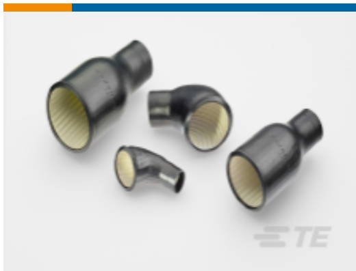
TE 产品编号EK7315-000 222S163-25C-0