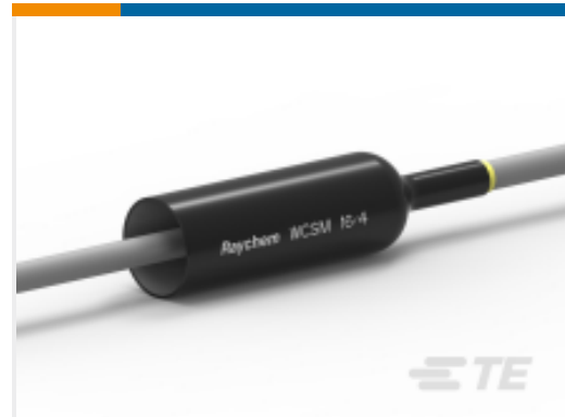
TE 产品编号CU9268-000 WCSM-16/4-125/S(S100)