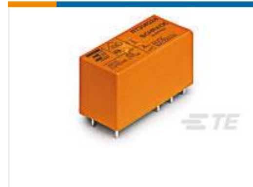
TE 产品编号6-1393243-8 RT424024