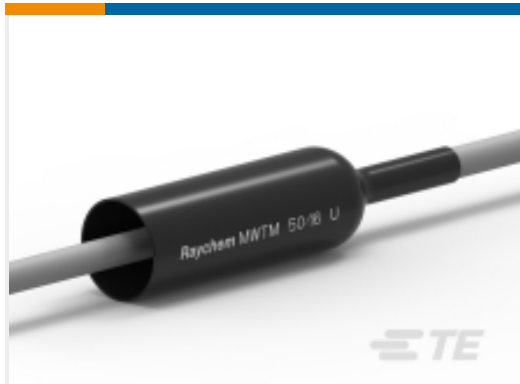
TE 产品编号413206-000 中厚壁热缩管