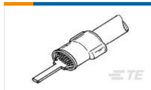
TE 产品编号131332 TERM, TAB, PIDG, 12-10