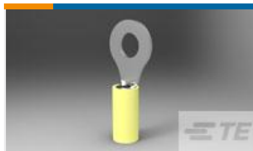
TE 产品编号35110 TERM, RT, PIDG,12-10, 1/4