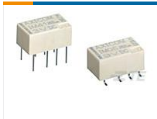
TE 产品编号4-1462037-7 IM07GR=IM RELAY 200mW 24VDC