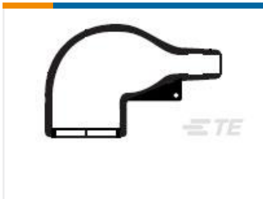
TE 产品编号878511-000 222K121-25-0