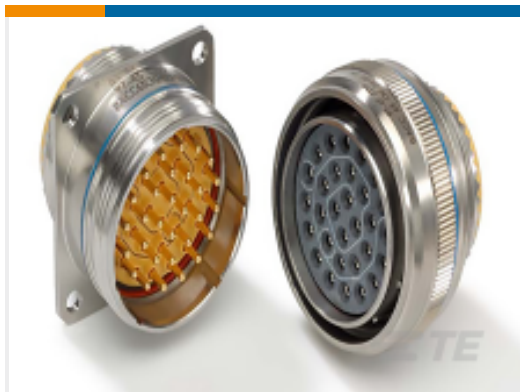
TE 产品编号ZPF00000000008933 983-6SE 18-31 PN-L