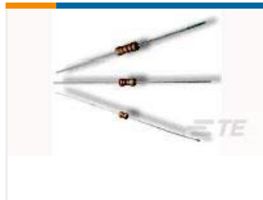
TE 产品编号2-1623928-8 CFR16 5% 4K7