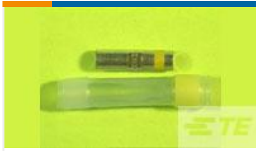
TE 产品编号650075N003 D-436-37CS454