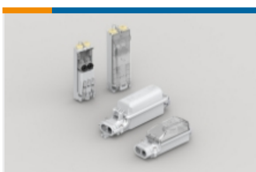
街道照明保险丝盒(200)