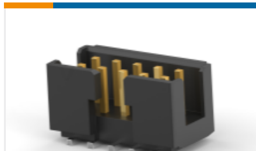
TE 产品编号1-2373376-0 10P,2MM,SHRD HDR,DRVT,SMD,0.1 AU,TB