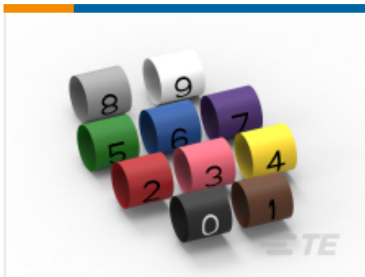
TE 产品编号EL66840001 TRSA-1019/E/1/B