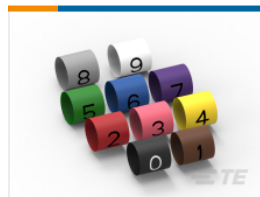
TE 产品编号5885930017 TRSA-1019/E/1/6