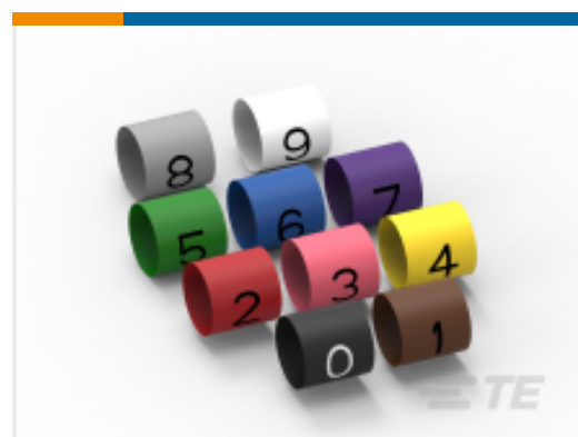
TE 产品编号5885930025 TRSA-1019/E/1/5