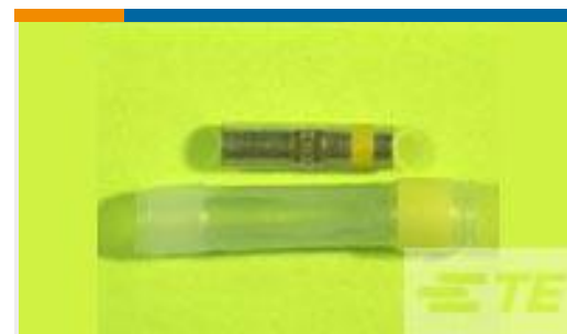
TE 产品编号650083-000 D-436-59