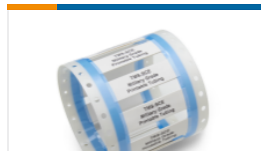
TE 产品编号7957790001 TMS-SCE Military Grade Sleeves