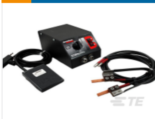
TE 产品编号 173643-000 RH-3960-1-TINEL-KIT-120V