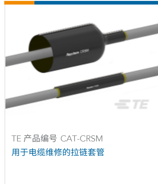
TE 产品编号 CAT-CRSM 用于电缆维修的拉链套管