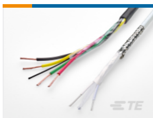
TE 产品编号CW9558-000 CBS-22CN21-21M-9