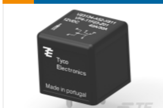
TE 产品编号1393302-6 VF415F13/X811