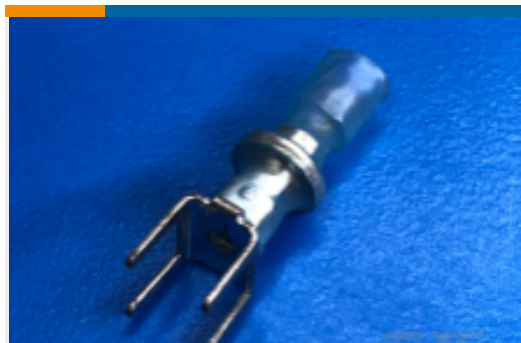
TE 产品编号601156-000 D-607-16