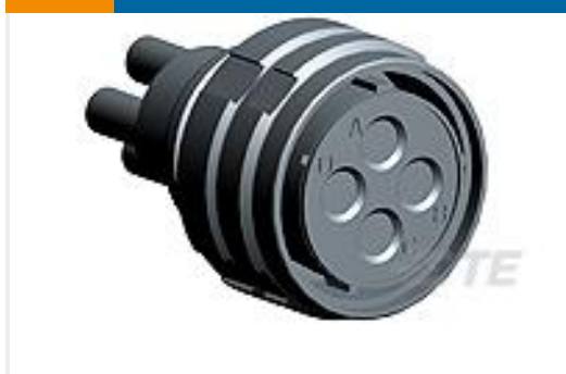
TE 产品编号1811902-1 ASY, PLUG, SIZE 19, FREE HANGING, N KEY