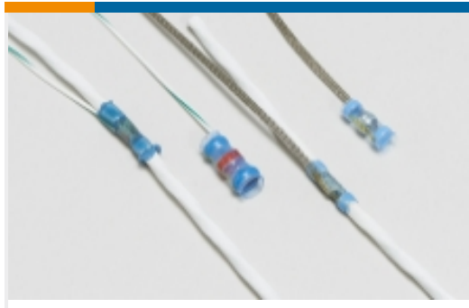
焊接套管屏蔽终结器(25)