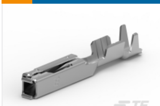
TE 产品编号1719958-1 GET 0.64 TERMINAL WIRE SIZE 0.