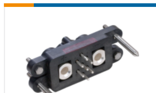
TE 产品编号ZPF000000000112143 FIXED FEMALE BLOCK 2+7P + CTS