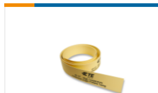
TE 产品编号EL8070-000 HT-CT-50M-3/32-OUT-4