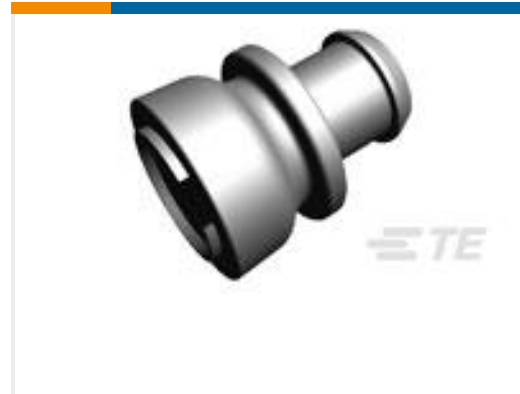
TE 产品编号828922-1 2,5MM CAVITY PLUG FOR 5,4MM DI