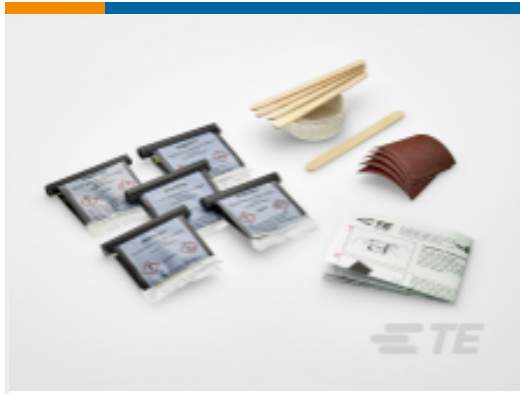
TE 产品编号878462-000 S1125-KIT-1