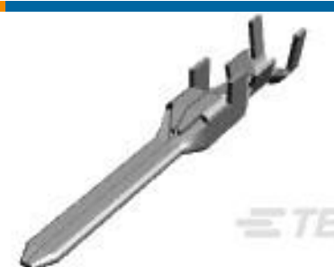
TE 产品编号 175285-3 DYNAMIC D-3 TAB CONT. M AU 0.76