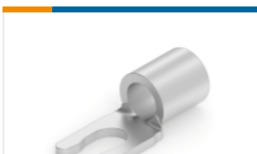
TE 产品编号 53126-1 TERMINAL,SOLIS SPR SPD 12-10 6