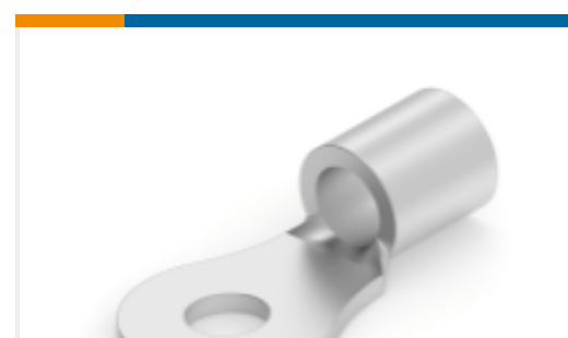
TE 产品编号 33456 TERMINAL,SOLIS R 12-10 6