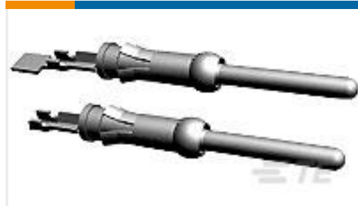
TE 产品编号 66564-8 III+ PIN,24-20,30AU/FL,STRIP