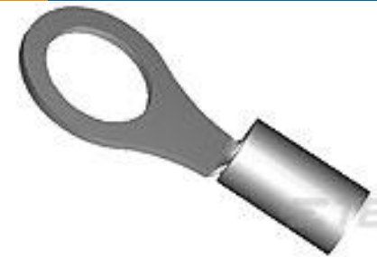
TE 产品编号 36927 BODY SOLIS RING 3/0 3/8