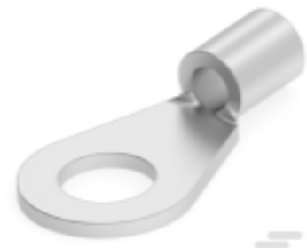
TE 产品编号 165293 SOLIS DIN 0.5-1.0 R M4