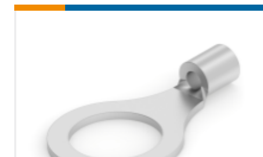
TE 产品编号 321165 TERMINAL,SOLIS R 16-14HD 1/2