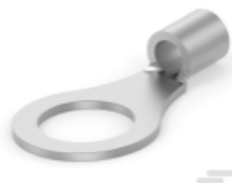
TE 产品编号 33220 TERMINAL,SOLIS R 12-10 3/8