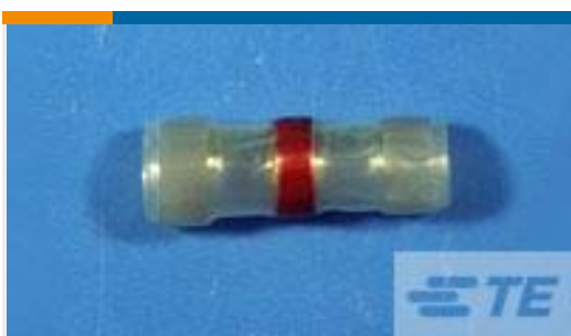
TE 产品编号 225107N001 D-1744-04CS378