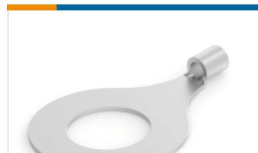
TE 产品编号 320764 TERMINAL,SOLIS R 12-10 5/8