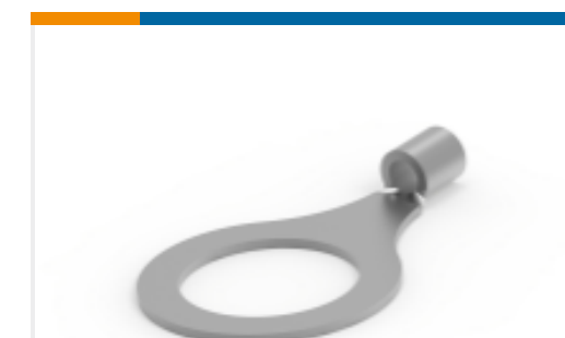
TE 产品编号 50981 TERMINAL,SOLIS R 16-14 1/2