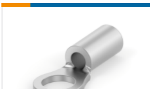
TE 产品编号 34194 SOLIS R 22-16 COMM 22-18 MIL 6