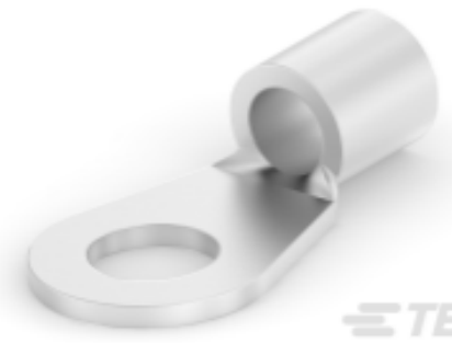
TE 产品编号 165302 SOLIS DIN 4.0-6.0 R M5