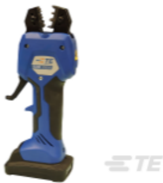
TE 产品编号 2280380-1 KIT, BT, MICRO SDE, 110V