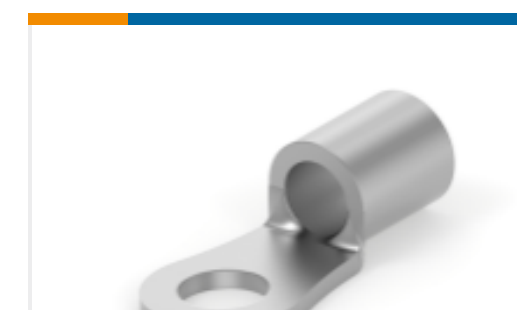
TE 产品编号 322454 TERMINAL,SOLIS R 12-10 8