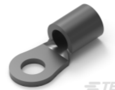
TE 产品编号 35476 TERMINAL,SOLIS R 12-10 6