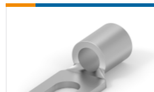
TE 产品编号 322451 TERMINAL,SOLIS SPD 12-10 6