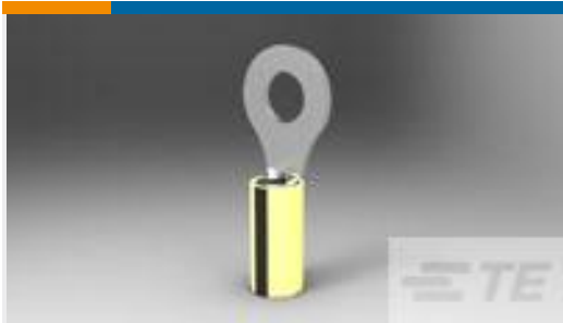
TE 产品编号 34806 TERMINAL,PIDG R 16-14HD 1/4