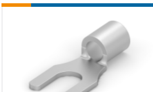
TE 产品编号 35495 TERMINAL,SOLIS SPD 12-10 10