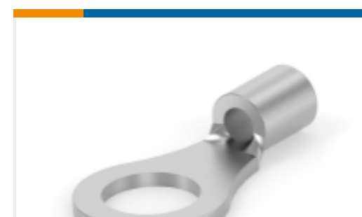
TE 产品编号 34112 SOLIS R 22-16COMM 22-18MIL 10