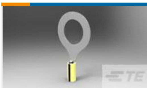
TE 产品编号 322724 TERMINAL,PIDG R 16-14HD 3/4