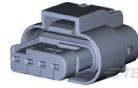
TE 产品编号 1-1456426-1 4POS, MCON 1.2 CB REC 2p TL SEALED