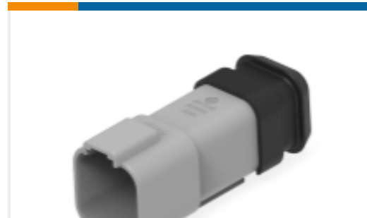
TE 产品编号DT04-6P-E008 REC, 6P, GRY, N, XCAP