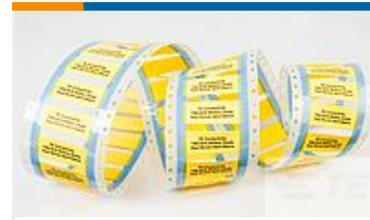
TE 产品编号577739-000 TMS-SCE-2-2.0-9