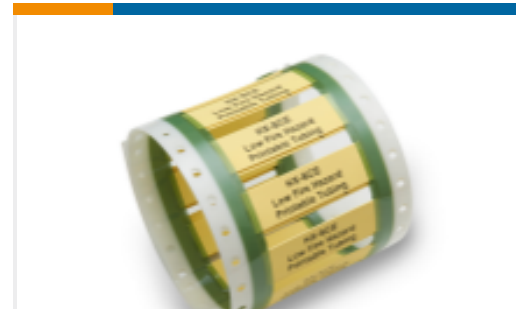
TE 产品编号D15532-000 HX-SCE Low Fire Hazard Sleeves