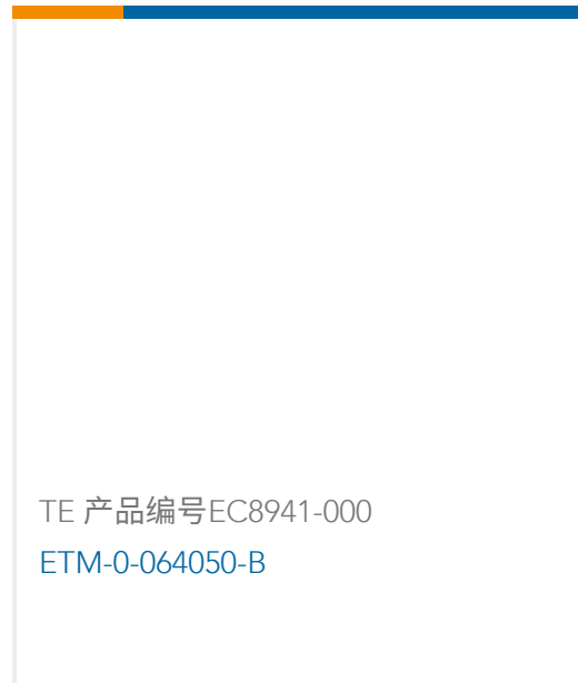
TE 产品编号EC8941-000 ETM-0-064050-B