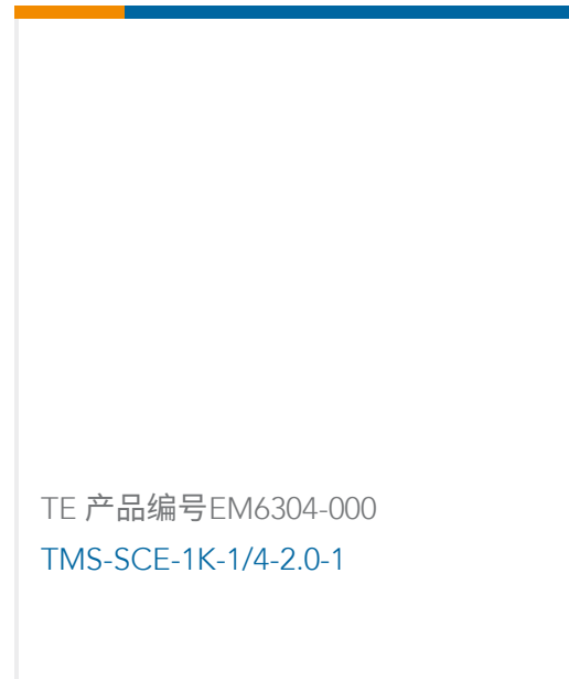
TE 产品编号EM6304-000 TMS-SCE-1K-1/4-2.0-1