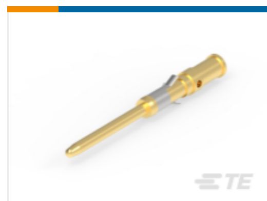
TE 产品编号 204219-1 PIN CONTACT ASSY.