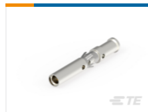
TE 产品编号 193846-1 SKT ASSY.