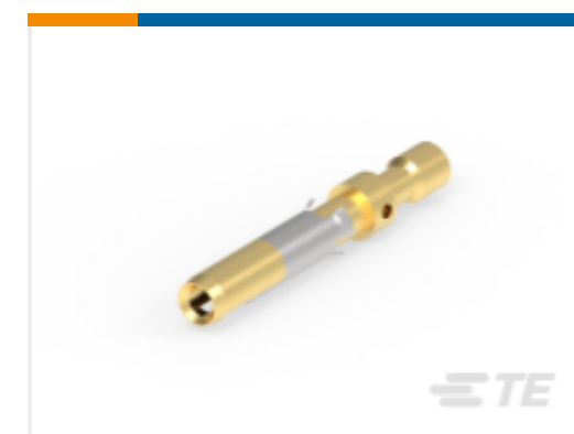
TE 产品编号 201328-1 CONTACT SOCKET ASSY.