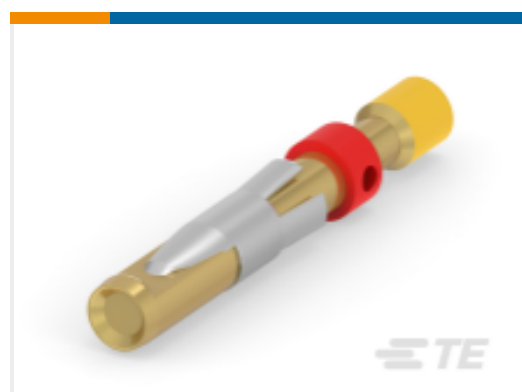
TE 产品编号 201580-1 SKT CONT ASSY,TYPE II