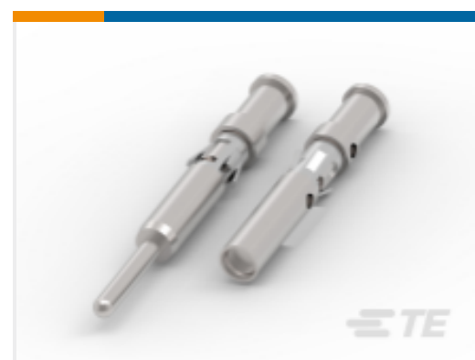
TE 产品编号 CAT-AM71-T98A Strip Pin and Socket Contacts, Type III, LP