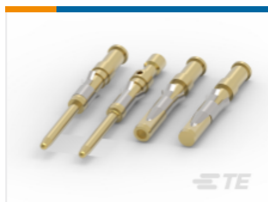
TE 产品编号 CAT-AM71-T98 Pin and Socket Contacts, Type II