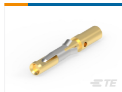
TE 产品编号 202726-1 CONTACT SOCKET ASSY.