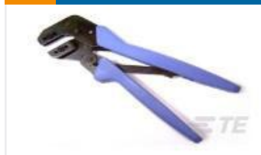
TE 产品编号58524-1 PROCRIMPER TOOL & DIE