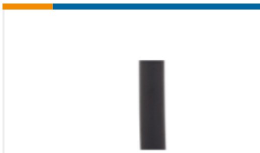
TE 产品编号ANT-315-CW-HWR-RPS Antenna 1/2 Wave Whip Swivel 315MHz RPS