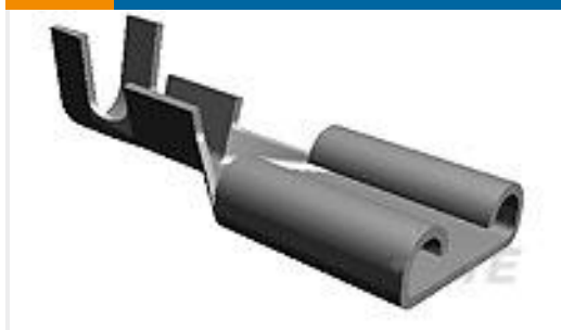
TE 产品编号61095-1 250 FASTON REC 14-10 AWG SPBR