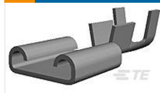
TE 产品编号62428-2 250 FASTON REC 12-10 AWG TPBR