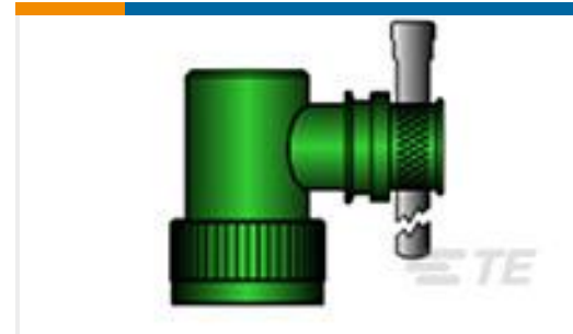
TE 产品编号CW4036-000 R85049/84-14W02