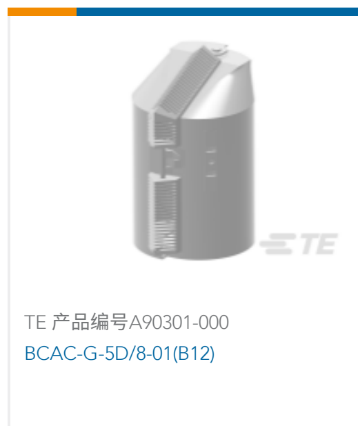
TE 产品编号A90301-000 BCAC-G-5D/8-01(B12)