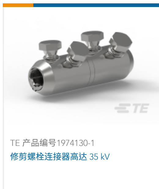
TE 产品编号1974130-1 修剪螺栓连接器高达 35 kV