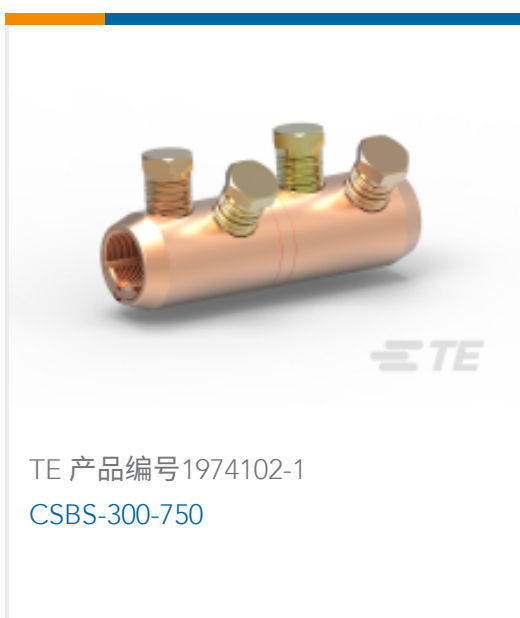
TE 产品编号1974102-1 CSBS-300-750