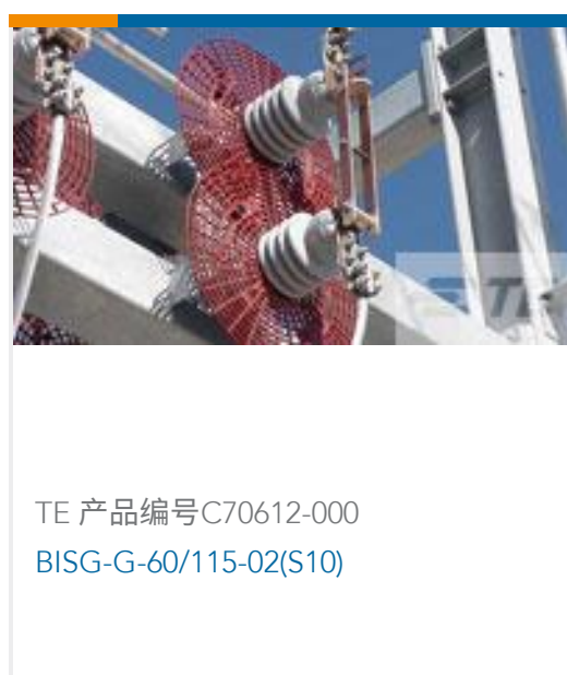
TE 产品编号C70612-000 BISG-G-60/115-02(S10)