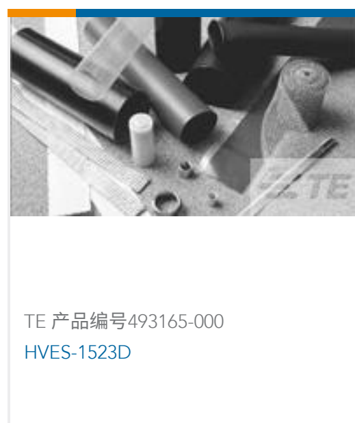
TE 产品编号493165-000 HVES-1523D