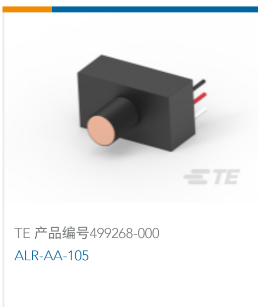
TE 产品编号499268-000 ALR-AA-105