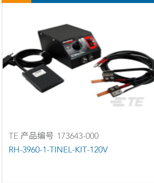
TE 产品编号 173643-000 RH-3960-1-TINEL-KIT-120V