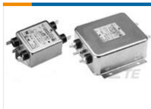
TE 产品编号6609043-2 6VV1=F7251 S0