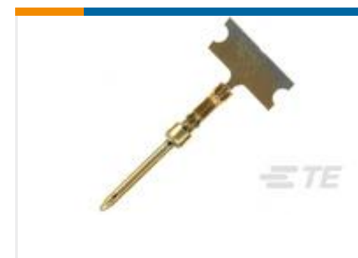
TE 产品编号66507-4 HD 20 DF PIN PLTD