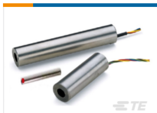
TE 产品编号02560390-000 LVDT HR 100 ASSY