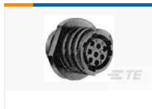
TE 产品编号206433-2 CPC RECPT ASSEMBLY SIZE 11-8