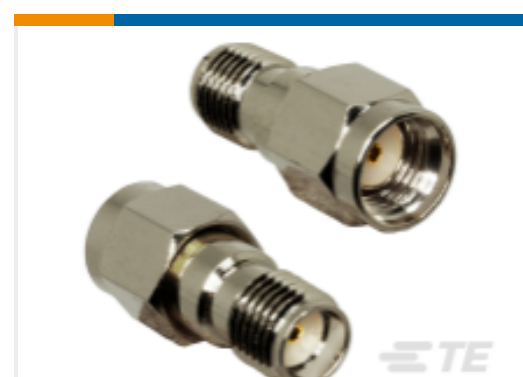
TE 产品编号ADP-RPSM-SMAF RP-SMA Plug to SMA Jack