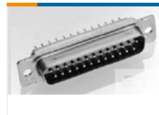
TE 产品编号204511-1 AMPLIMITE,ASY,PLUG,STD,90,6