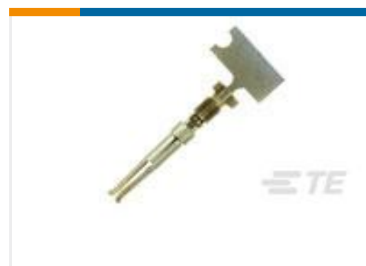
TE 产品编号1658538-3 SOCKET CONT DUPL PLT STRIP HD-