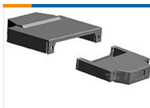
TE 产品编号5788362-1 .8MM CHAMP BACKSHELL KIT