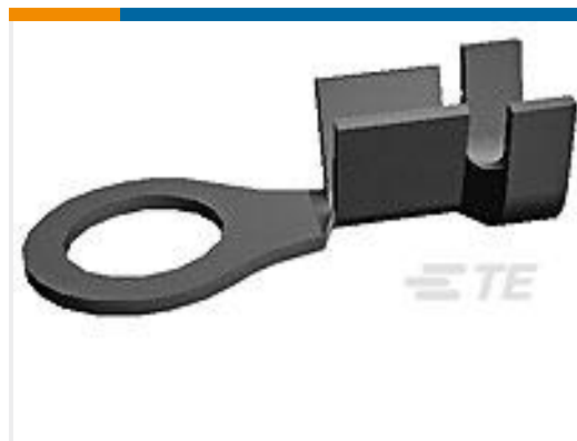
TE 产品编号170225-1 RING TERMINAL