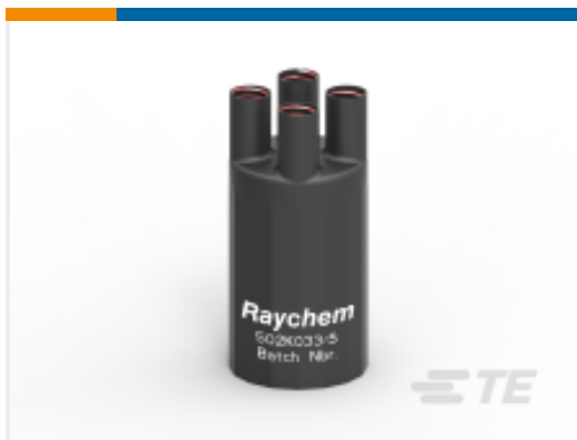
TE 产品编号E00553N001 502K033/S(S15)