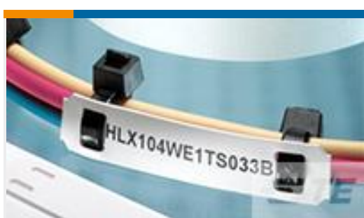
TE 产品编号EC7654-000 HLX203YW1TS050B