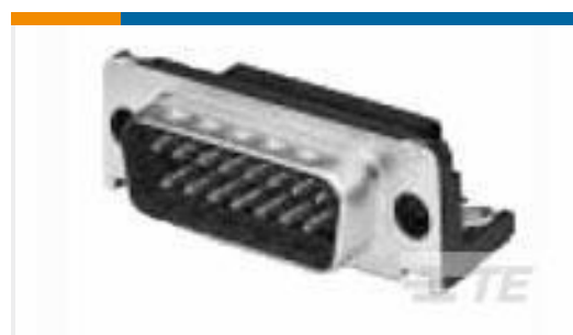
TE 产品编号5788792-1 09 HTMSFL PLUG RA 318 (IN,BL)