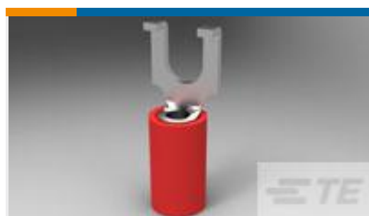
TE 产品编号2-32562-2 PIDG SPDFLG 22-16COM22-18MIL 8