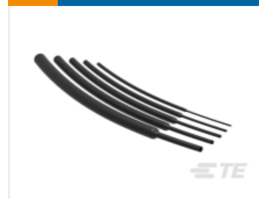
TE 产品编号E05774-000 VERSAFIT-1/4-0-25MM