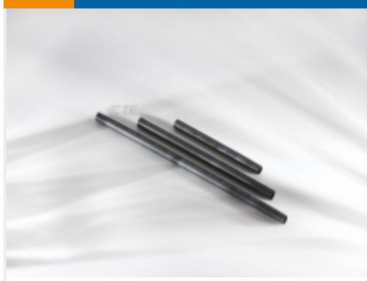
TE 产品编号537637P033 SCT 热缩管