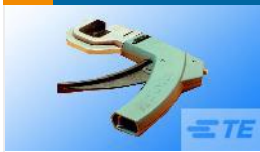
TE 产品编号58246-1 MTA 100 CRIMP HEAD REPAIR DISCRETE