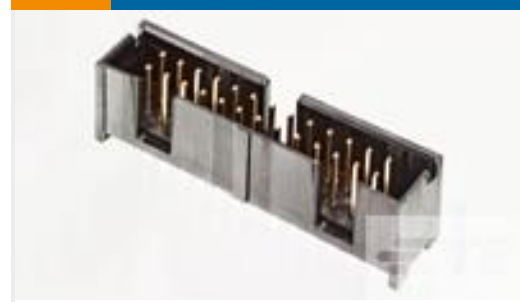
TE 产品编号5103308-5 A/L LOW PRO HDR 20P VERT BLACK