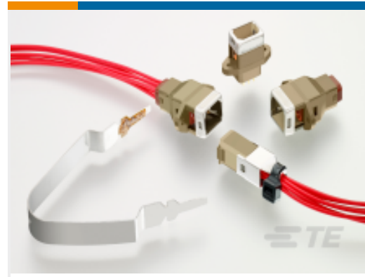
TE 产品编号CTJ620E12N-5145 PLUG ASSY